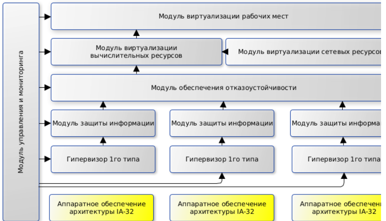
Фигура 1: Логическая структура ПО Звезда Алькор